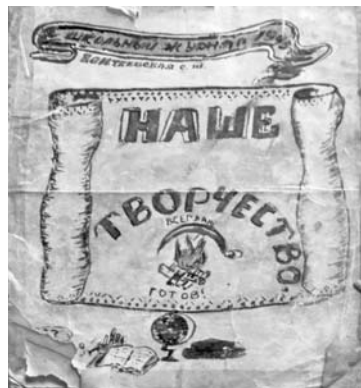
Рукописный журнал «Наше творчество», который выпускали эвакуированные дети блокадного Ленинграда (1943 год)

детей были, конечно, не барские. Хотя, в общем, все было сыто. Шло лето. В Ленинграде еще было спокойно. И в ответ на жалобы ребят стали приезжать родители и забирать их домой. Было даже так: приезжают чьи-то папа или мама и говорят: «Ну, кто хочет в Ленинград? Поехали со мной». И уезжали с ними по четыре-пять человек. В будущую блокаду, фактически на верную смерть».